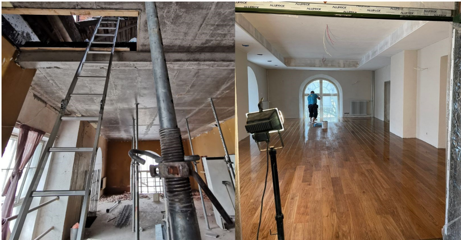
Kabel enne ja praegu

Kevadel alanud tornitööd on edenenud tõesti suurepäraselt. Peauksest tornialusesse ossa sisse astudes on pilt mõne kuu tagusest väga erinev: põrandad ja saali ossa jääv rõdu on valatud, ruume eraldavad seinad, mitte kujutlusvõime, veetud on kütte, vesi, elektri- ja nõrkvoolukaablid, seinad on krohvitud, suures osas värvitudki, enamus siseuksi paigaldatud jne.