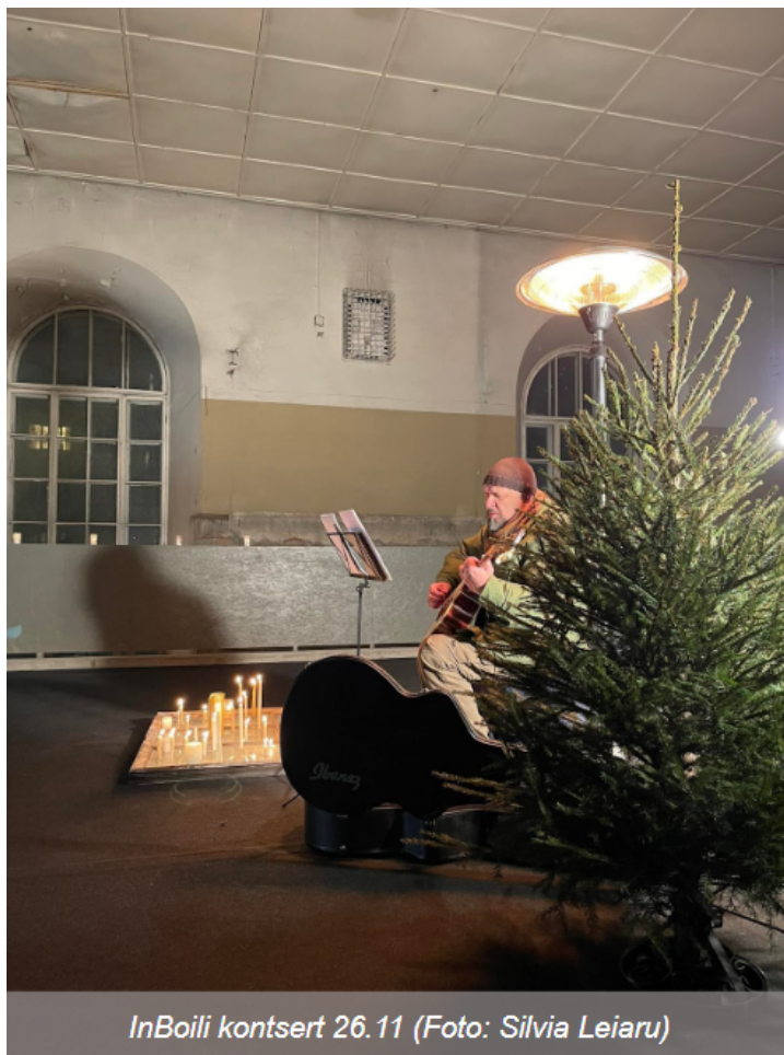
InBoili kontsert 26.11

Annetustelefonide reklaamiga toetab meid iga-aastaselt Tartu linn. Ikka on meile leitud vaba koht kesklinnas rippuvate plakatite kalendris, Tartu laatadele oleme olnud alati väga oodatud (sel aastal külastasime Tartu Kevadlaata) ning koostöös saab ellu viidud nii mõnigi projekt.