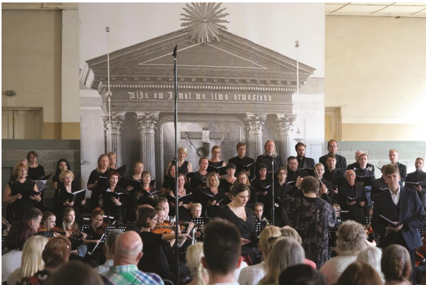
Kontsert Tartu Maarja kirikus