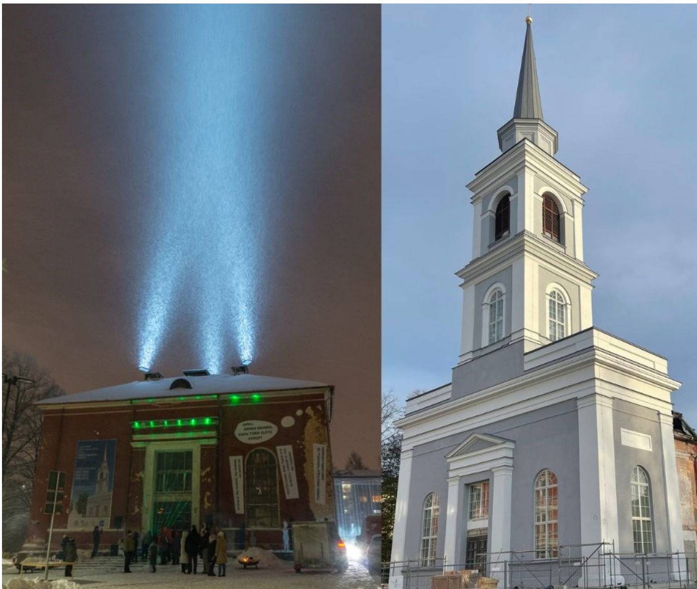
Maarja torn enne ja pärast

Kellarõdul on õuetemperatuur, kuid aknad kaitsevad tuule ja vihma/lume eest.