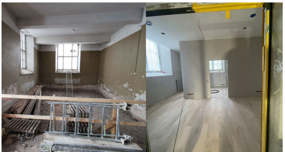
Kantselei enne ja praegu

Teine kuni viies korrus on köetavad ning ruumid soojad. Viienda korruse seinad eraldavad soojad ruumid kõrgemale jäävatest külmadest, küteta ruumidest. Kaheksanda korruse kellarõdu klaaskoridor aga kuuenda ja seitsmenda korruse õuetemperatuurist.