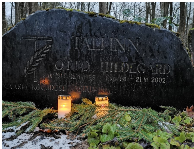
Õpetaja Tallinna hauakivi Tartu Pauluse kalmistul