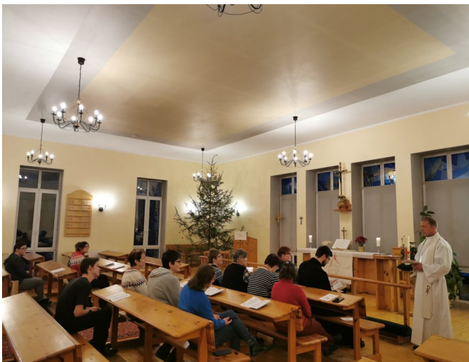
Erivajadustega inimeste piiblitund