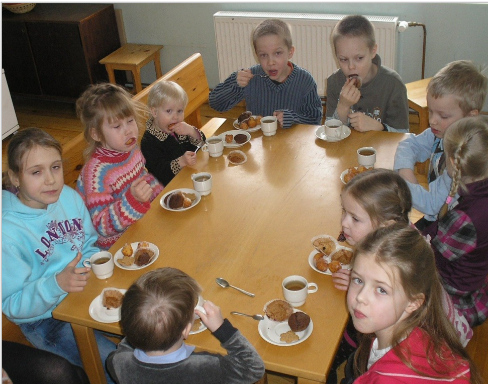
Pühapäevakooli lapsed aastal 2011