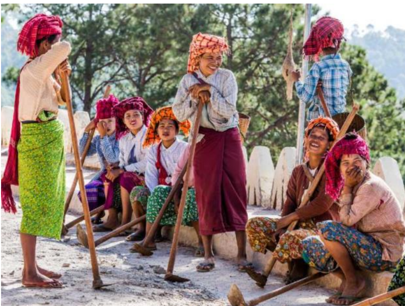
Misjonitööl Myanmaris said tuttavaks kohalikud inimesed ja olustik

Valitud juhtorganite ametiaeg kestab neli aastat.